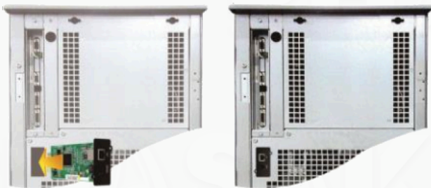
SNMP II (Para SAI On Line Trifásico)